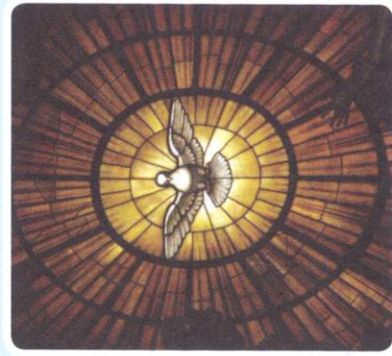
Duh Sveti (bazilika sv. Petra, Vatikan)