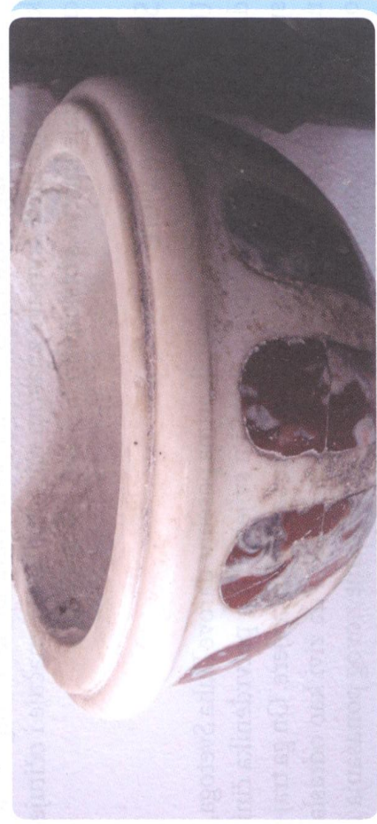
Posuda za blagoslovljenu vodu (crkva sv. Anselma, Nin)