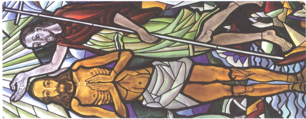
Ivica Šiško, Krštenje Isusovo

»Da više ne budemo nejačad kojom se valovi poigravaju i koje goni svaki vjeter nauka u ovom kockanju ljudskom, u lukavosti što put krči zabludi.«