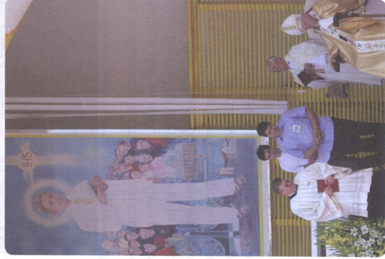
Drugi posjet Ivana Pavla II. Bosni i Hercegovini, beatifikacija Ivana Merza, Banja Luka, 22. 6. 2003.

Laici naime nisu u službi Crkve, nego su Crkva kao subjekt u punom značenju te riječi. Temeljem sakramenata – krštenja i potvrde – laici su »apostoli« Crkve, tj. poslani su raditi na tome da svi ljudi po svoj zemlji upoznaju i prihvate Božju poruku spasenja . »Bog ih