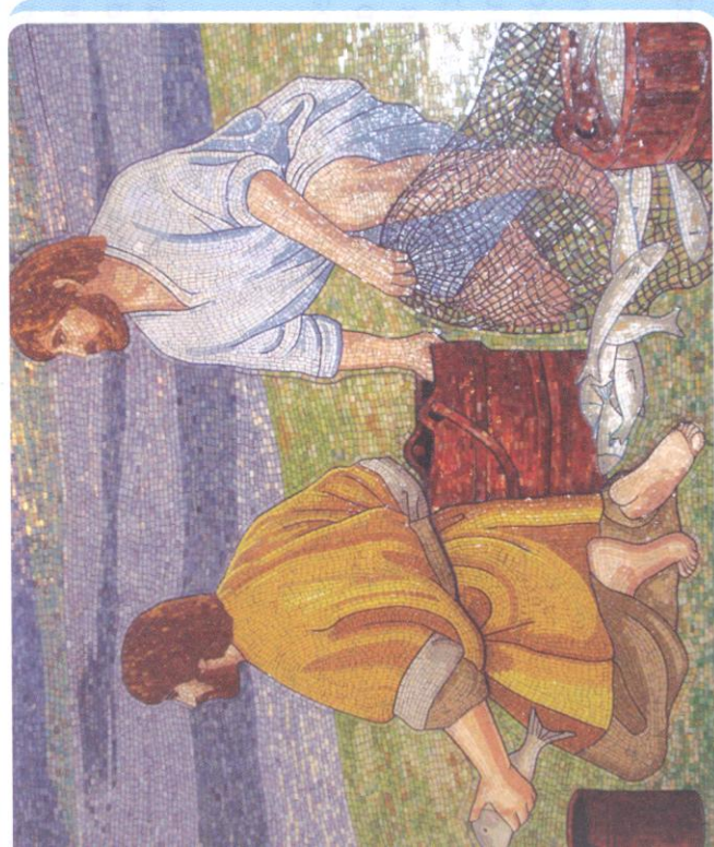
Atelje Stanišić, detalji mozaika (crkva Krajlice neba i zemlje, Ploče)

Prije slavljenja pojedinog sakramenta, prezbiter priprema vjernike koji žele primiti taj sakrament, kao i sve one koji su izravno uključeni u to slavlje. Upućuje vjernike u dublje proživljavanje vjere i u odgovorno življenje svoga kršćanskoga poziva. Posebno se brine za bolesne, tako da ih posjećuje te, zajedno s njima i njihovim bližnjima i dragima, moli i dijeli pomazanje. Po primljenom sakramentu reda prezbiter je pozvan skrbiti i za odgoj zvanja, te poticati one koji su pozvani da se velikodušno odazovu Božjem pozivu. U svemu je najvažnije njegovo osobno svjedočenje vlastitoga poziva i vjere u svakodnevicu.