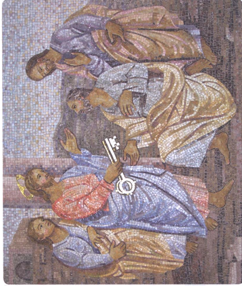
Isus predaje Petru ključeve (Vatikan)

Sv. Ivan Pavao II. kao poglavar Crkve pozivao je na zauzimanje za jedinstvo svih kršćana. Neumoran je bio u ponavljanju kako kršćani ne bi smjeli biti razjedinjeni. Isticao je kako samo Duhom obnovljena i ujedinjena Crkva može među svima narodima biti uzdignuti znak nade i sigurnosti u trećem tisućljeću. Rekao je kako »ekumenizam uključuje i to da si kršćanske zajednice međusobno pomažu, kako bi u njima bio uistinu prisutan sav sadržaj i svi zahtjevi baštine predane od apostola. Bez toga puno zajedništvo neće nikada biti moguće.«