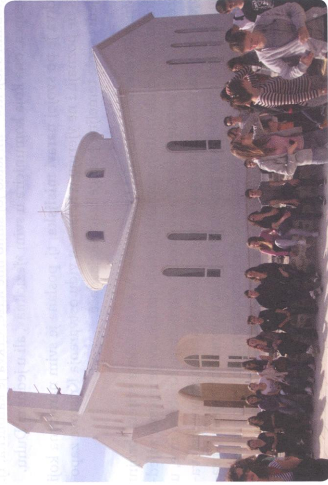
Crkva hrvatskih mučenika (Udbina)

Crkva, vođena ljubavlju i snagom Duha Svetoga, ostvaruje to poslanje tako da – primjerom života, propovijedanjem i slavljenjem sakramenata – sve ljude i narode privodi k vjeri, slobodi i Kristovu miru, kako bi postali dionici Kristova otajstva spasenja. Božja riječ je sjeme iz kojega svuda u svijetu trebaju izrasti domaće, odnosno mjesne Crkve koje, u jedinstvu s cijelom Crkvom, pridonose rastu i zajedništvu sveopće Crkve.